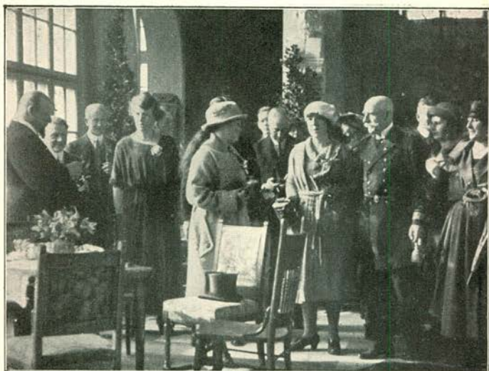
Z. K. H. PRINS HENDRIK EN DE INSPECTEUR VAN DEN GENEESKUNDIGEN DIENST DER ZEEMACHT