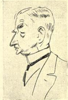
De President- curator.