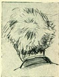
De rector-magnificus van twee kanten bekeken.