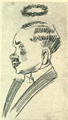
De jonge doctor wordt „gehuifd”.