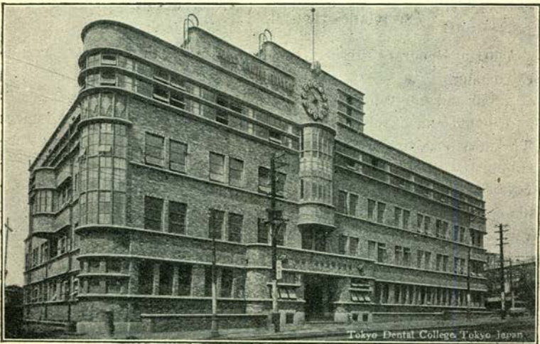
Nieuwe Tandheelk. Instituut te Tokyo.

Wij hopen hier later nog eens uitvoeriger op terug te komen.