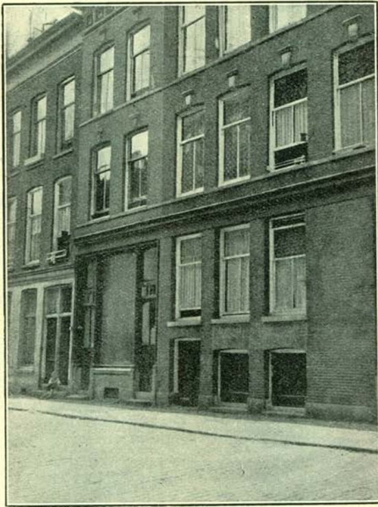
De voormalige groentewinkel Aert. v. Nesstraat 84 hoek Nadorststraat, waar de Werkende Leden in 1917 gedurende eenige maanden de tandheelkunde beoefenden.

Met goeden moed zal verder gewerkt worden.