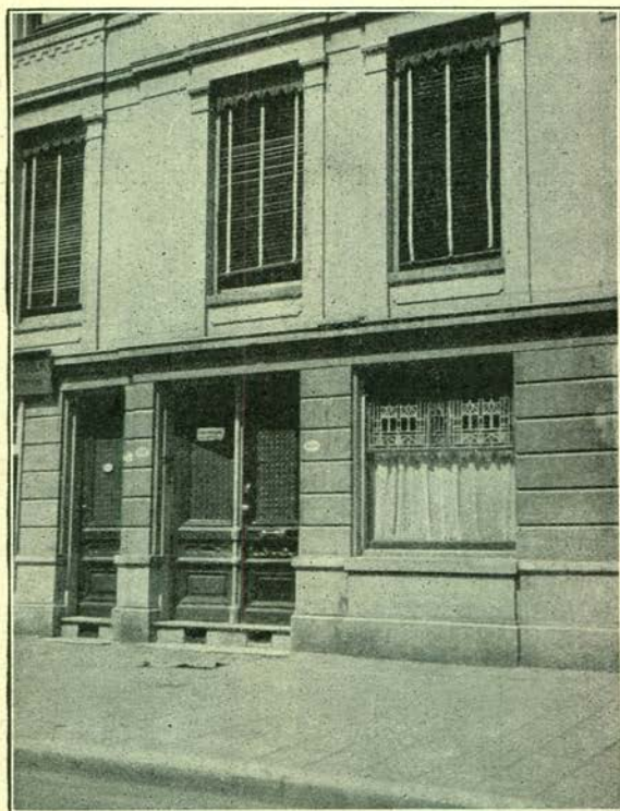
Het pand Aert van Nesstraat 93, waar de in 1901 opgerichte kliniek der R. T. V. voor het eerst gevestigd werd.

Hoe komt het, vroeg Frank, dat in ons land het voorbeeld van