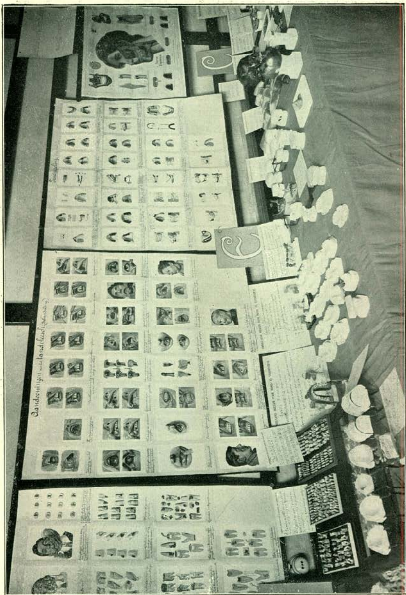
Een ander kijkje op de Tentoonstelling.