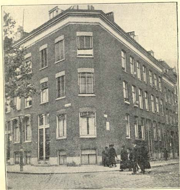
Het pand Goudschesingel 135 in 1923 ingericht als 2de kliniek der R. T. V.

Maar met dat al werd door het Bestuur toch de noodzakelijkheid gevoeld, dat in onze stad voor den fondspatiënt naar een