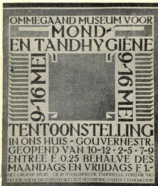
De reclameplaat voor de Tandheekundige Tentoonstelling, die van 9—19 Mei 1920 te Rotterdam gehouden is.

ces voor deze vereeniging, die reeds in het eerste jaar 4000 exemplaren verspreid zag. Het klinkt voor een outsider wel eens verwarrend dat samengaan der beide vereenigingen. Maar zij, die met de geschiedenis dier dagen bekend zijn, weten dat de bovengenoemde leden der Propaganda Commissie van de R. T. V. tevens Voorzitter, Vice Voorzitter en 1ste Secretaresse van