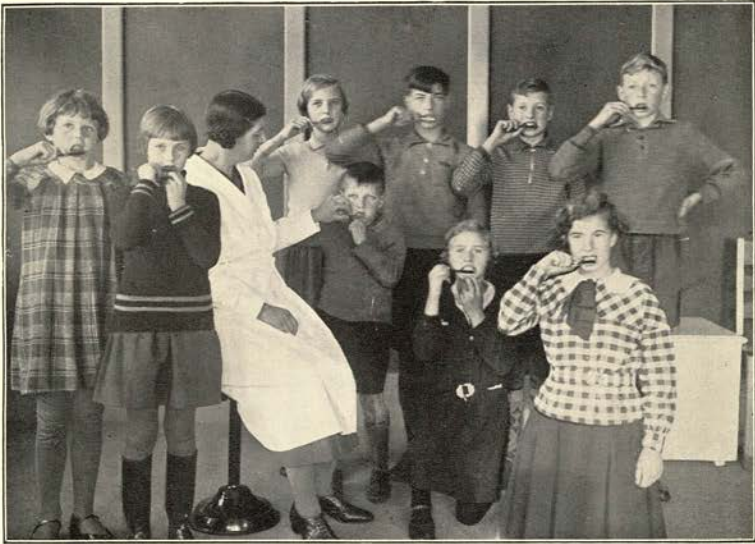
Fig. 3. Schooltandverzorging te Zaandam. Klassikaal borstelen.