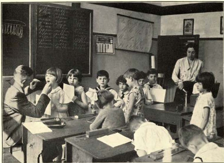
Fig. 1. Schooltandverzorging te 's-Gravenhage Inspectie der Kindermondjes.