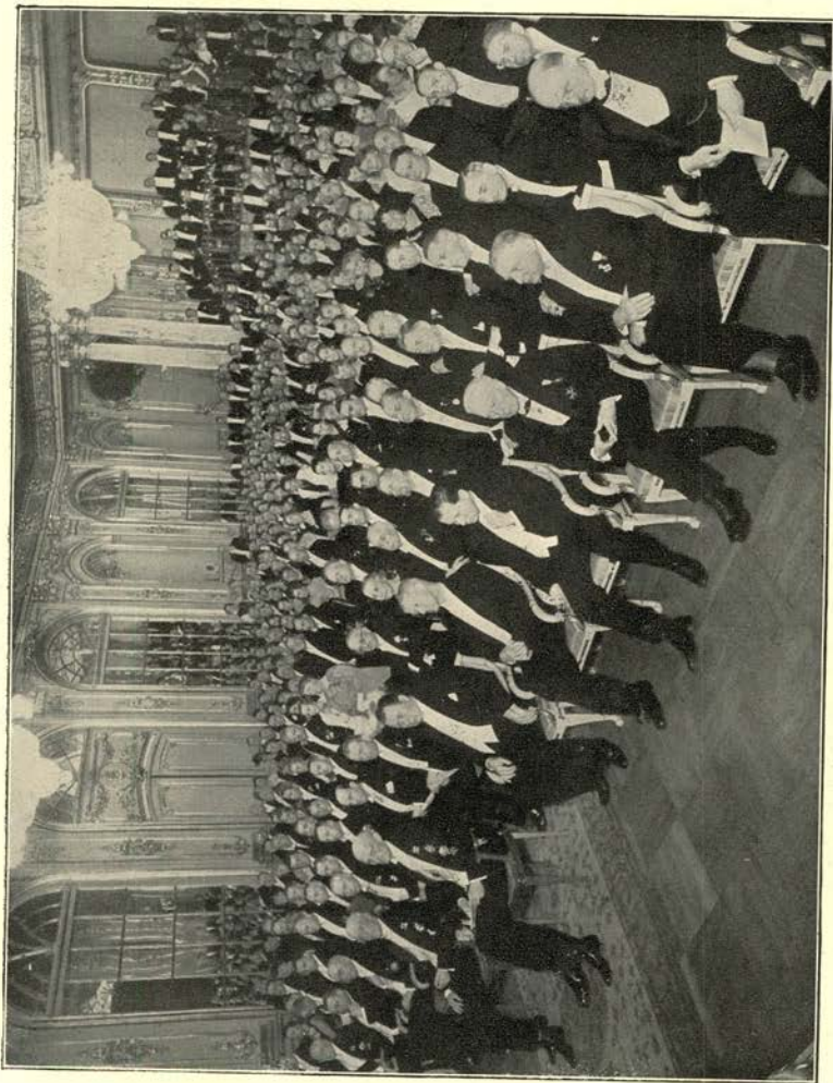
De opening van het congres in tegenwoordigheid van den koning (links).