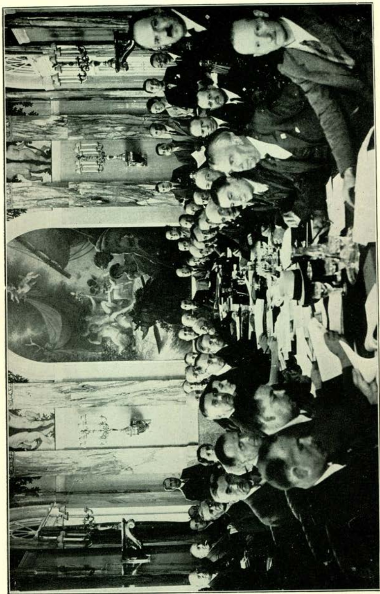
Conseil Exécutif. Weenen, Augustus 1936.