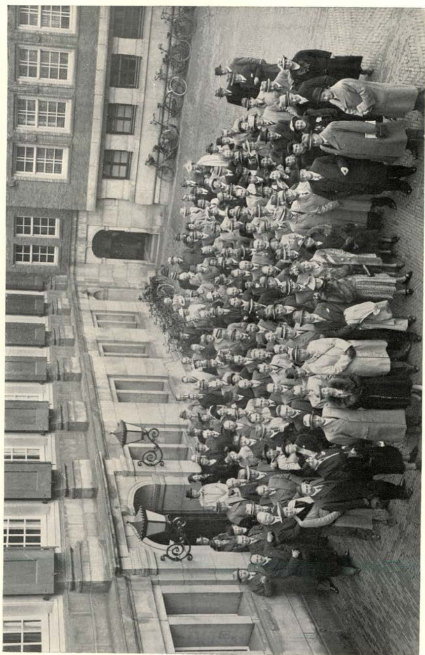
Op het binnenplein van het stadhuis te Amsterdam.