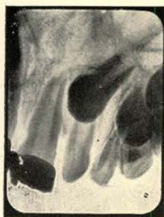
Afb. a 24-6-'42