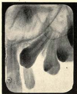
Afb. b 6-2-'46