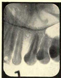
Afd. c 27-6-'49