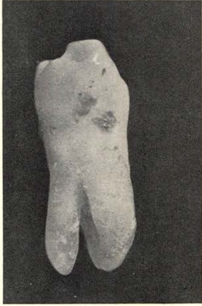
P 1 is mesiale zijde