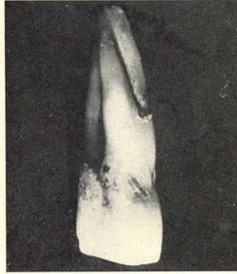
I 1 sup. sin. van mesio-palat. gezien