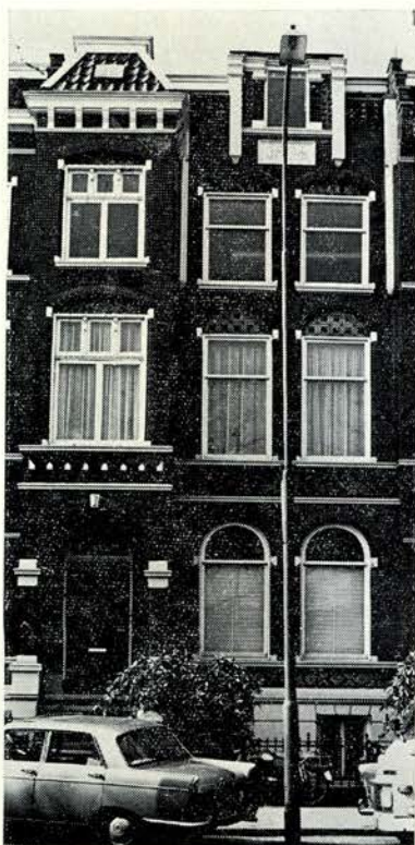
Het pand aan de Catharijnesingel 76 te Utrecht.

pleitte reeds in zijn brochure „De positie van de tandtechnicus in Nederland” een dergelijke schoolopleiding.