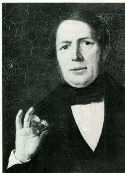
Afb. 1. Mansportret met sigaar.

De resultaten waren al meteen verrassend. Zelfs op de 6 kleine films bleek, dat de sigaar blijkbaar over een prothese geschilderd was, die de man in zijn rechter hand hield. Het witte loodzink op titaanoxide, gebruikt bij de verf voor de ivoorprothese, kwam duidelijk te voorschijn. Ik maakte nieuwe röntgenopnamen met negatieven 13 x 18 cm, die ik systematisch op het schilderij plakte. Ik belichtte ze na elkaar; de foto van de prothese werd de fraaiste (afb. 3). Het