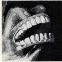
Afb. 4. Na restauratie: de sigaar blijkt een Afb. 5. Detail. prothese.

van een vroeger onderzoek door tandarts G. H. Bisseling uit Den Haag bleek, dat in de Amsterdamse Courant van 1843 No. 104 een advertentie stond van de volgende inhoud: