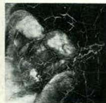
Afb. 2. Detail.