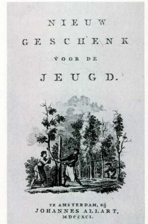
Afb. 5. Titelprint met een (aan Andry ontleend) zinnebeeld van de orthodontie.

Tenslotte zij nog opgemerkt dat Martinet in samenwerking met A. van den Berg, twee reeksen van zes deeltjes voor kinderen heeft geschreven die Paasman als voorlopers van kindertijdschriften beschouwt: 'Geschenk voor de jeugd' (1781) en 'Nieuw geschenk voor de jeugd' (1791) waarin niets staat dat ons aanbelangt maar waarvan de titelbladen versierd zijn met een gravure die veel gelijkenis vertoont met het door Andry in 1740 ingevoerde symbool voor de orthopedie, een symbool dat ook geldt voor de orthodontie (Cernea, 1974; Gysel, 1974 a).