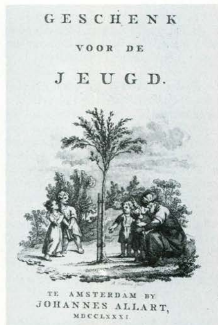
Afb. 4. Titelprint met een symbool van de orthopedie.

'omtrent dit stuk, dat nieuw is en waaraan geen kleine arbeid vast is, heeft men het met de meting en berekening der Meisjes, Vrijsters en Vrouwen noch zo ver niet kunnen brengen. 't Is genoeg, dat gy de opmerkelijke Evenredigheid en Aanwas der Lichaamsdeelen in Uwe Sexe ziet, om het verwonderlyk Werk van den Schepper der Menschen daarin te onderkennen (P. 329.)