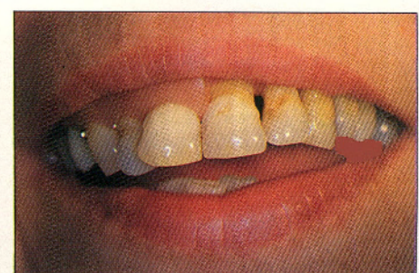
Afb. 2. Een epithese verbetert de cosmetiek.