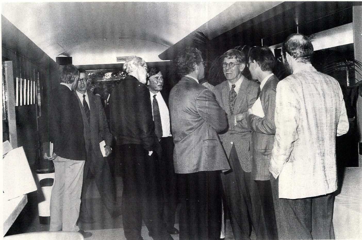
In de pauzes was het voor de genodigden uit de verschillende gelederen van 'tandheelkundig Nederland' een genoeglijk treffen.