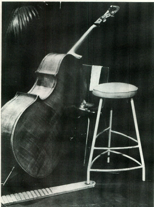
Contrabas tijdens de pauze.