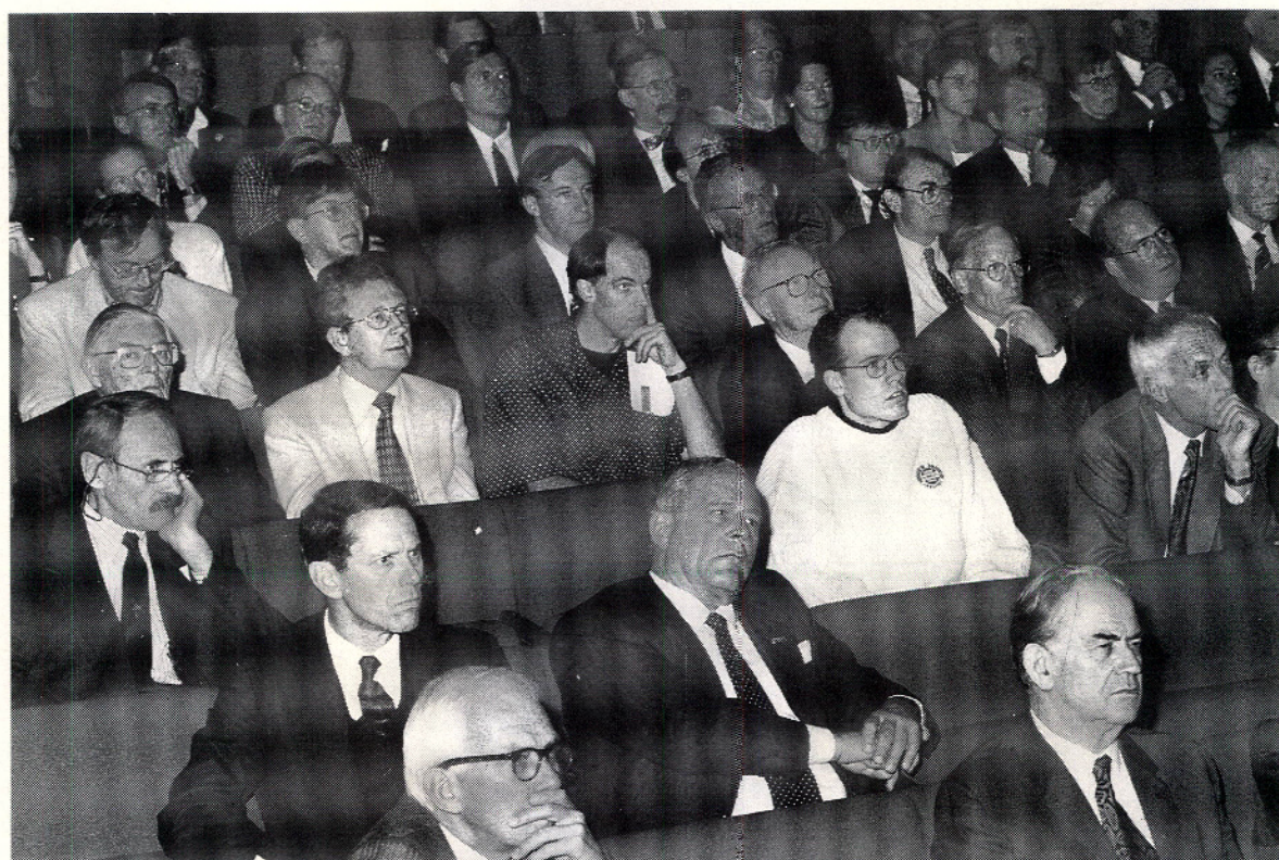
Een aandachtig luisterende volle zaal tijdens een van de lezingen.