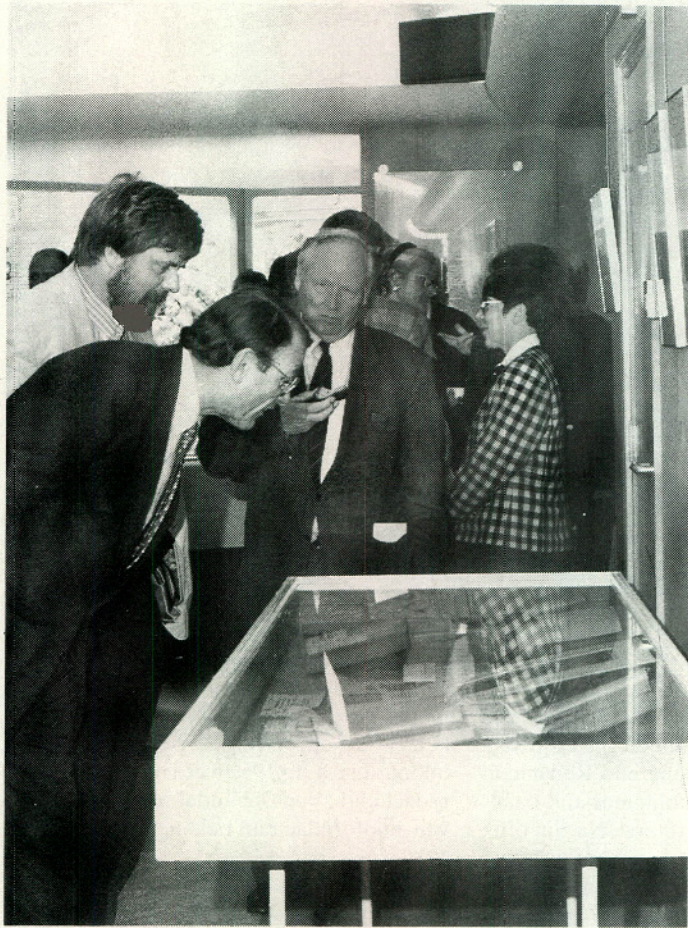
In een vitrine waren zeer oude, Nederlandstalige tandheelkundige boekwerken uit het Nederlands Tandheelkundig Museum te bezichtigen.