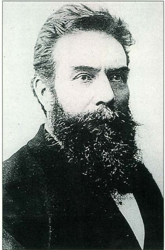
Wilhelm Conrad Röntgen (1845-1923).

Met veel enthousiasme is door diverse auteurs een gevarieerde aflevering tot stand gekomen. Daarin worden zowel het verleden, het heden als de toekomst van de tandheelkun-